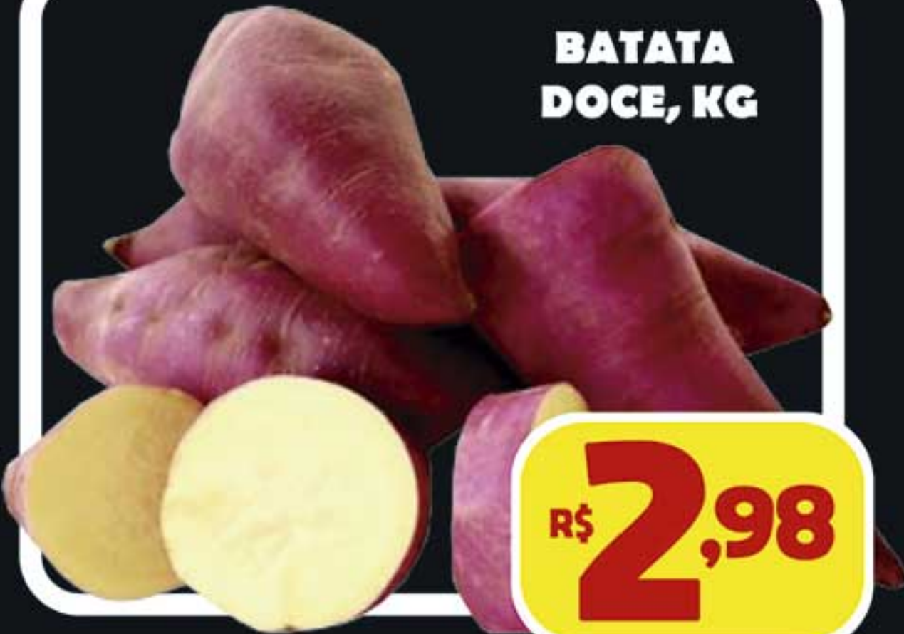
BATATA DOCE, KG