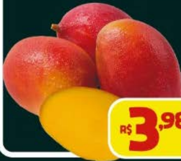
MANGA PALMER, KG