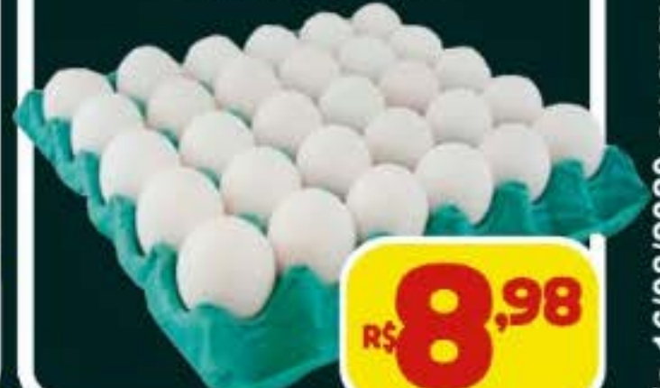
OVOS BRANCOS CARTELA C/30