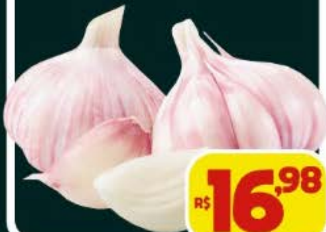
ALHO BRANCO, KG