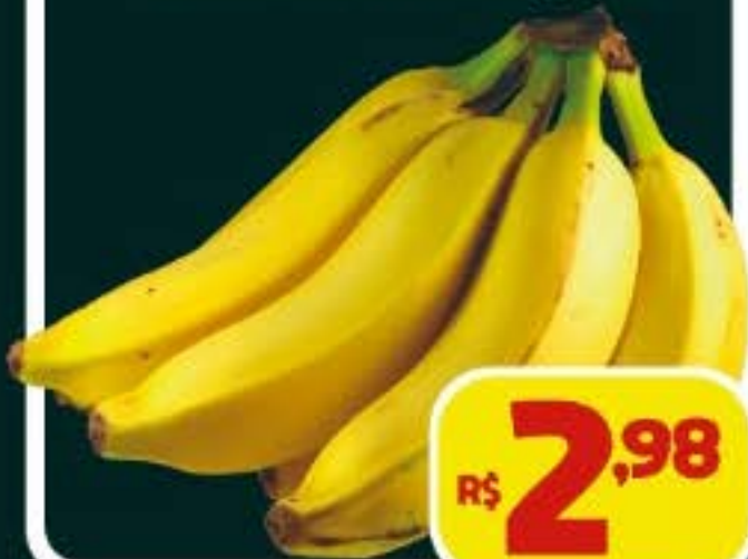
BANANA PRATA, KG