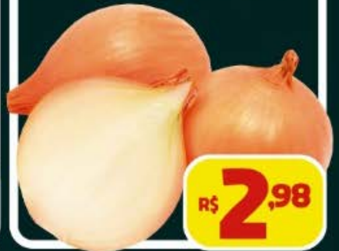
CEBOLA NACIONAL, KG